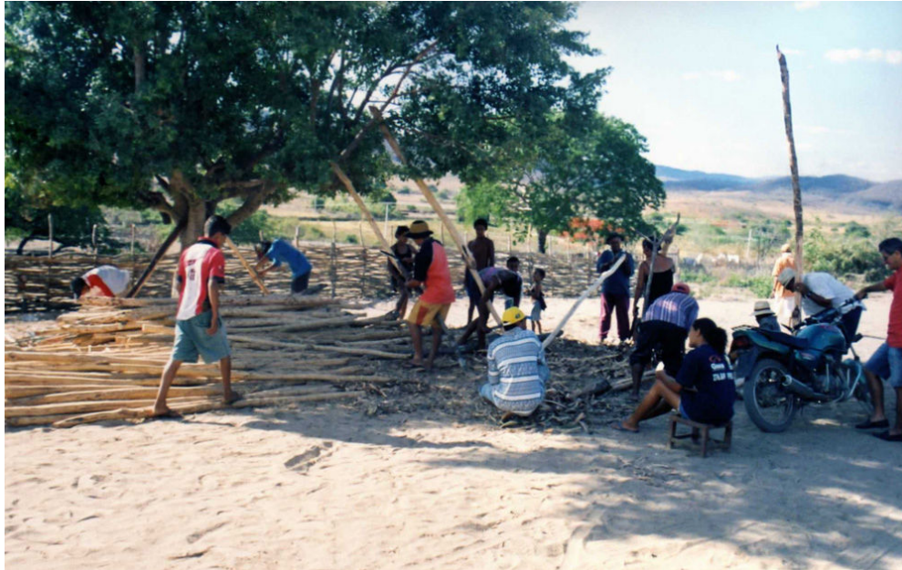
Figura 5 – Aula prática do Curso

teve duração de 05 semanas com aulas expositivas e práticas (Figura 5). A seqüência do curso partiu de um histórico da técnica construtiva, passando pelas inovações tecnológicas e os procedimentos construtivos, na orientação das terraplenagens e das fundações, ao aperfeiçoamento da execução da taipa, chegando aos revestimentos e coberturas. A orientação se estendeu também nos diversos aspectos de manutenção da construção.