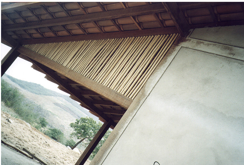
Figura 11 - Beirais largos para proteção das alvenarias