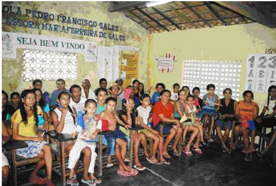
Figura 02 – Comunidade do Minador

A comunidade é composta de casas isoladas entre si, tendo sempre a amplitude da paisagem da planície (Figura 3). O acesso à comunidade se dá por estrada de terra, de tráfego difícil devido à topografia íngreme ladeada por precipícios. A topografia de serra faz do caminho uma sucessão de subidas e descidas constantes. A estrada tem sempre lugares de quedas de barreiras e deslizamentos tornando o caminho perigoso. No trajeto para esta comunidade, a subida é de mais ou menos quatrocentos metros em relação à sede do município.