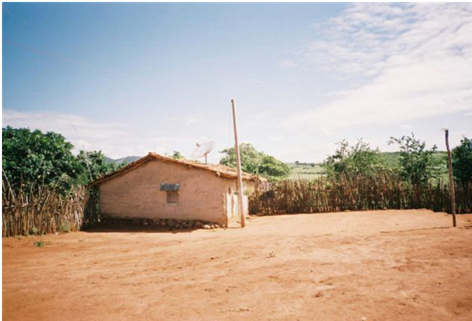
Figura 4 - Padrão construtivo local

até a construção do Centro de Cultura Negra. A produção agrícola é de milho, mandioca e feijão e a criação é de caprinos e suínos. Quase toda tração é animal e não existe mecanização agrícola na comunidade.