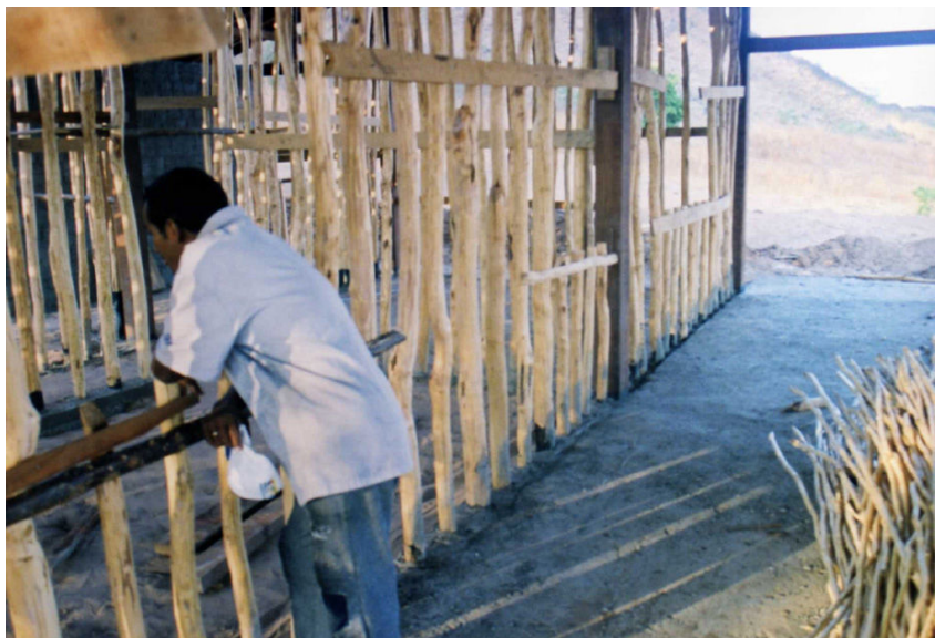
Figura 7 – Peças de estroncas selecionadas, descascadas e tratadas para receber a fixação das varinhas

As paredes de taipa são constituídas de enxamel - uma estrutura formada com estroncas e ripas (varinhas) de madeira, formando o gradeamento (Figura 7). Os vazios são preenchidos com barro compactado, amassado com os pés, em duas etapas para garantir o fechamento das frestas. Depois de a parede seca, recebe um nivelamento onde é aplicado o reboco com areia, cal ou cimento, cobrindo possíveis fissuras e impermeabilizando a superfície (Figura 8).