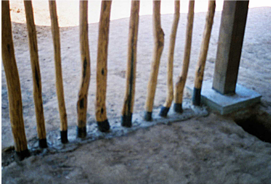
Figura 6 – Tratamento das madeiras com inseticida e impermeabilizante

De maneira sucinta, demonstramos aqui algumas etapas de construção do centro de cultura, com a adição de algumas tecnologias. Junto ao solo, foi criada uma base impermeabilizada, protegendo as madeiras (pilares e estroncas) da umidade do solo (Figura 6) com cintamento em concreto.