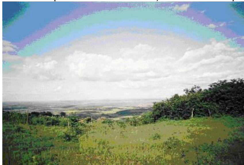
Figura 3 – Vista da Paisagem de Minador

A comunidade é composta de casas isoladas entre si, tendo sempre a amplitude da paisagem da planície (Figura 3). O acesso à comunidade se dá por estrada de terra, de tráfego difícil devido à topografia íngreme ladeada por precipícios. A topografia de serra faz do caminho uma sucessão de subidas e descidas constantes. A estrada tem sempre lugares de quedas de barreiras e deslizamentos tornando o caminho perigoso. No trajeto para esta comunidade, a subida é de mais ou menos quatrocentos metros em relação à sede do município.