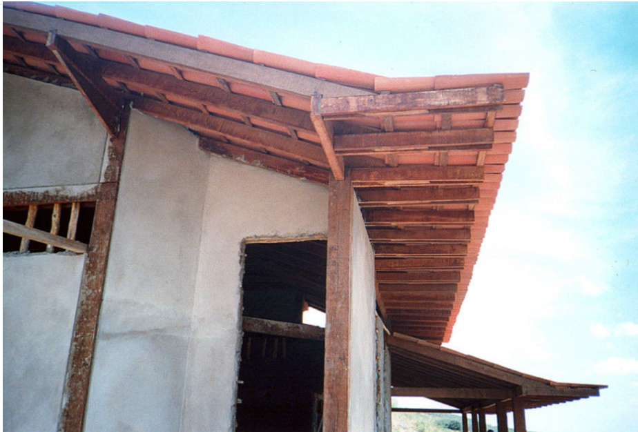
Figura 10 - Beirais largos para proteção das alvenarias e esquadrias

Os telhados foram montados com telha de barro, formando grandes beirais para proteger a construção do sol e das chuvas, permitindo aberturas para a ventilação e iluminação naturais (Figuras 10 e 11).