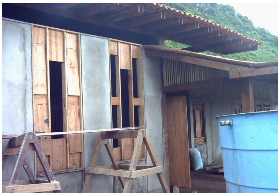
Figura 9 - Esquadrias produzidas pela comunidade

As esquadrias foram produzidas pela comunidade, com modelos alternativos aos fornecidos pelo comércio local. (Figura 9).