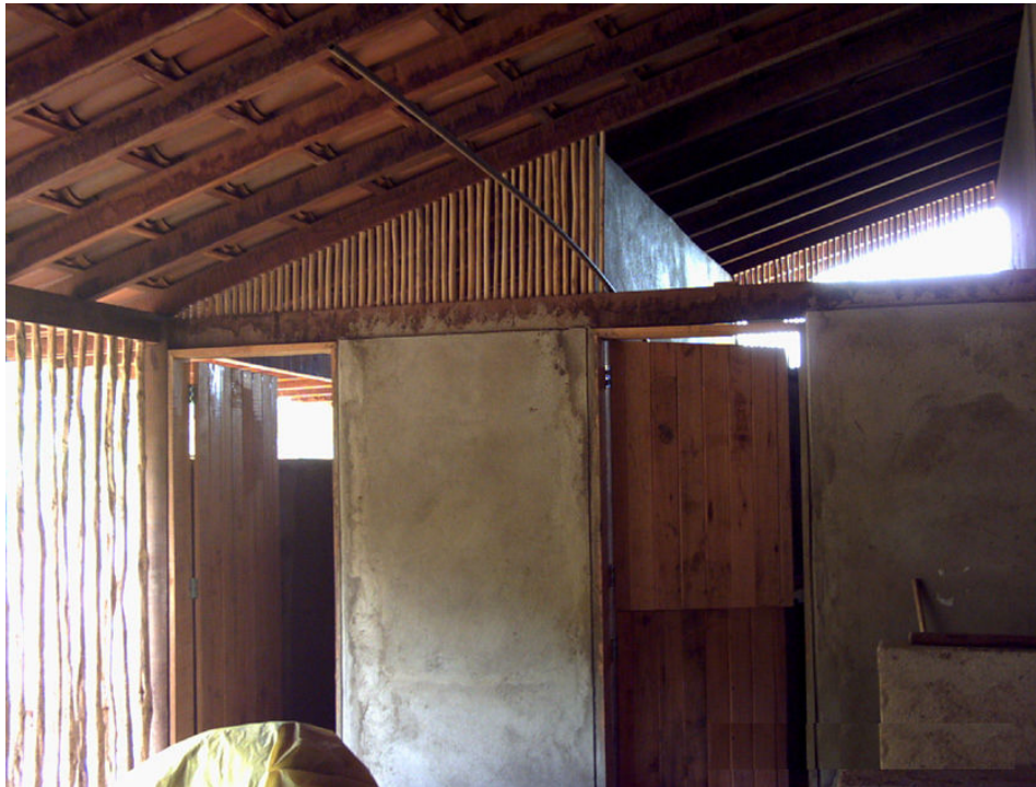
Figura 8 – Paredes rebocadas e niveladas com régua (opcional)

As esquadrias foram produzidas pela comunidade, com modelos alternativos aos fornecidos pelo comércio local. (Figura 9).