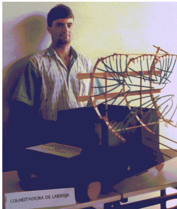
Figura 2. Foto mostrando um acadêmico de Projetos I na defesa de seu “projeto desafio”.

Como resultados, podem-se citar alguns trabalhos acadêmicos que se integraram aos anseios da comunidade. Todo ano realiza-se uma Mostra de Trabalhos aberta a comunidade e onde são socializados e apresentados os resultados dos “projetos desafio”. Cada estudante possui um espaço para defesa e apresentação oral do modelo icônico tridimensional e do relatório de seu projeto desafio, conforme mostrado na Figura 2.