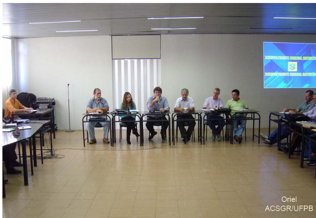
Figura 2 – Reunião na SIUSP com pesquisadores da UFPB, empresários e instituições de fomento.

Para atingir estes objetivos, a SIUSP conta atualmente com diversos parceiros tais como: Associação Brasileira da Indústria Hoteleira; Banco do Brasil; Banco do Nordeste; Caixa Econômica Federal; Clube dos Diretores Lojistas; Centro de Indústrias do Estado da Paraíba; Confederação de Empresas Junior; EMBRAPA; FAEPA/SENAR; Federação do Comércio; Federação das Médias e Pequenas Empresas; Federação da Indústria do Estado da Paraíba; Governo do Estado da Paraíba; Prefeitura da Cidade de João Pessoa; PBGÁS; SEBRAE; PNUD/ONU entre outros.