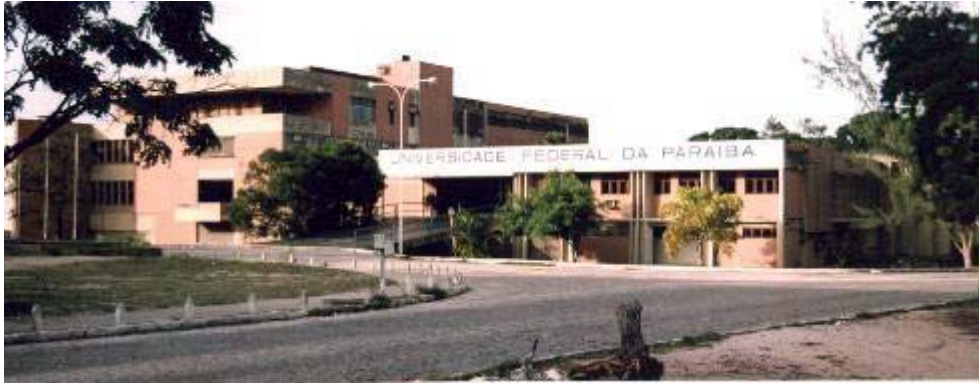
Figura 1 – Vista da Reitoria da UFPB onde funciona a SIUSP.

Uma das atuações da SIUSP é a coordenação de diretrizes de tecnologia industrial básica, tais como patentes, metrologia, certificação, normalização e inovação, bem como, dispor de um banco de dados das potencialidades e ofertas da UFPB, visando atender as demandas da sociedade. Desta forma a SIUSP vem implantando na UFPB uma cultura do empreendedorismo e fortalecendo a interação da Universidade com órgãos de fomento a ações empreendedoras a nível nacional e internacional.