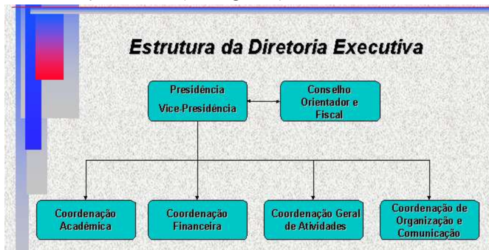
Figura 1 – Diagrama Organizacional do DAEE/CAEEL.

De uma parte das pessoas da gestão 2002–2003, originou-se a diretoria executiva da Gestão 2003–2004, que tomou posse em abril de 2003. Esta também foi uma chapa única composta de 7 membros de diretoria e 13 membros efetivos das coordenações e foi referendada pela graduação. Foi pré-definida uma nova estrutura organizacional para operacionalizar a atuação do DAEE ( Vide Figura. 2 ).