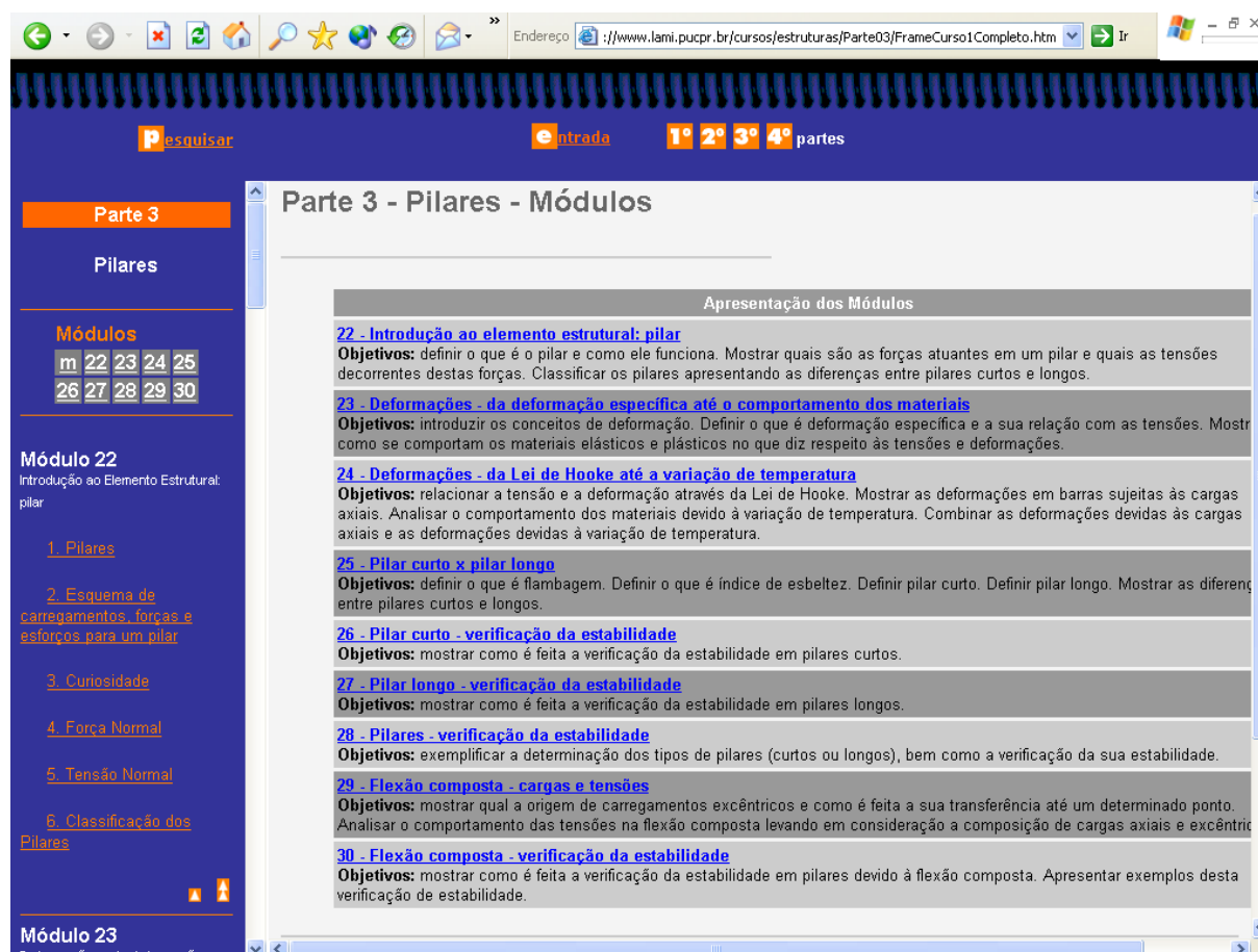
Figura 1 – Itens e sub-itens de módulo do conteúdo do Programa de Aprendizagem

Para o conteúdo elaborado pode se construir uma página web ou gerar material multimídia para um CD-ROM através de softwares específicos, como por exemplo os bem conhecidos Flash e o Dreamweaver da Macromedia atualmente nas versões MX ( http://www.macromedia.com/br/ ). Nas Figuras 1 e 2 aparecem exemplos dos muitos hipertextos gerados para um dos módulos do programa de aprendizagem (disciplina) em apreço.