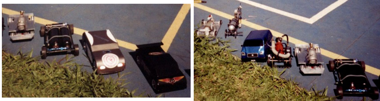
Figura 3. Exemplos de produtos desenvolvidos na disciplina Projeto Integrado III.

Verifica-se, claro, oportunidades de melhoria no processo, tais como a necessidade de melhor equipagem dos Laboratórios da Escola, a fim de facilitar e agilizar o desenvolvimento das atividades práticas, de informática ou de fabricação, exigidas dos alunos nas disciplinas, a ampliação do grupo de professores envolvidos diretamente com as atividades de Projeto Integrado, a fim de incrementar o apoio logístico aos grupos de alunos, e a ainda maior organização do processo como um todo, a fim de agilizar a correção de rota de grupos de alunos que pode acabar apresentando, por várias razões, alguns desvios indesejáveis no seu trabalho.