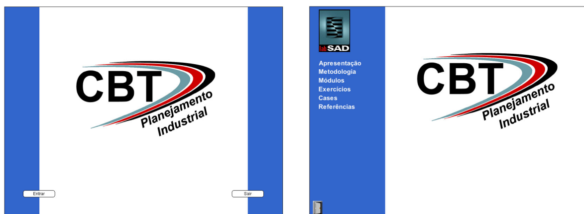
Figura 2 – Tela de acesso ao ambiente e seqüência de navegação no conteúdo.

O desenho de interface do CBT exigiu estudos de uma série de conceitos relativos ao conforto visual, ergonômico e estético. A Figura 2 apresenta a interface escolhida para tela de acesso e saída do ambiente de ensino.