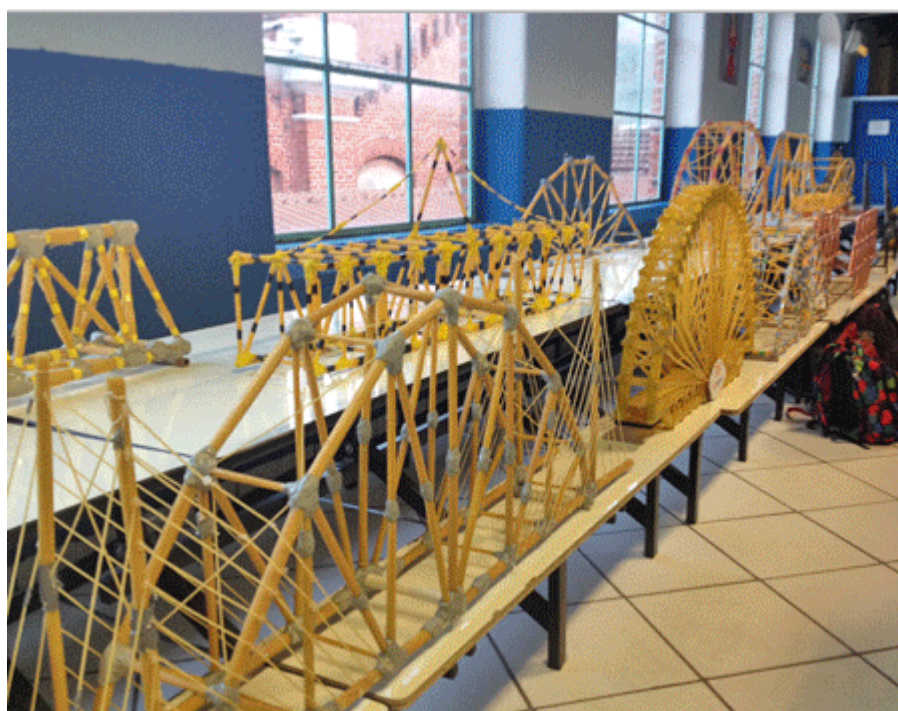
Figura 2: Exposição dos Projetos para apreciação dos discentes e docentes da instituição.

O concurso ocorreu em duas unidades da Instituição de ensino em dias separados. Os alunos deveriam levar os seus projetos para breve exposição como apresentado na figura 2. Neste momento os grupos expositores ficam localizados próximos as suas pontes de macarrão e fazem uma prévia aos visitantes, apresentado o conceito estrutural e a necessidade do múltiplo conhecimento para a criação do projeto.