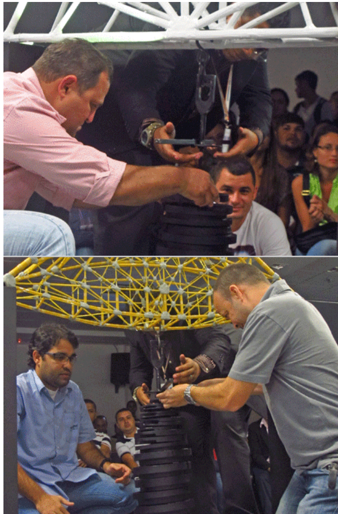
Figura 03: Teste de carga das Pontes de Macarrão.

Ao momento da ruptura, que não poderia acontecer com um valor menor que 50Kg, pois a equipe seria desclassificada, todos os 250 espectadores dentre eles os alunos, professores e funcionários que se mantinham em silêncio, o que tornava o projeto estimulante. Ao final do teste que sempre ocorria na ruptura como apresentado na figura 04, todos os que se encontravam presentes se emocionavam e demonstravam através de gestos, gritos de torcida.