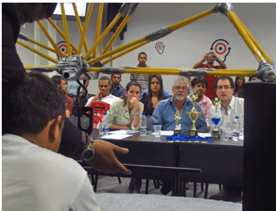
Figura 05. Posicionamento estratégico para otimizar o processo avaliativo dos docentes.