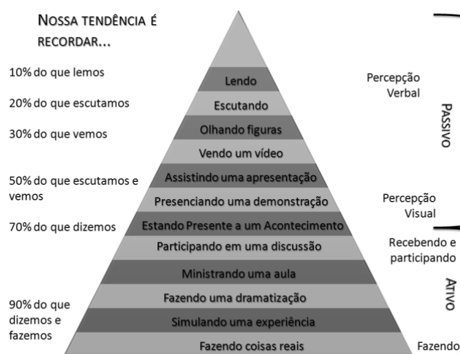
Figura 3. Pirâmide da aprendizagem

Logo a pirâmide da aprendizagem permite concluir que o exercício prático é uma forma ideal de aprender e ensinar. Os estudantes de engenharia costumam construir seus protótipos enfrentando sérios problemas financeiros. MEMS lhes oferece uma possibilidade diferente, pois o protótipo depende diretamente da disponibilidade de computadores. Porém, compreender e expressar as limitações do software e dos processos utilizados na fabricação de MEMS é fundamental para o estudante de engenharia e informática, uma vez que softwares não são absolutos. De fato, a modelagem matemática de alguns macro-fenômenos, o qual é o foco de maior parte dos CADs em engenharia, não é válida sob estas dimensões, pois novos fenômenos se manifestarão e necessitarão ser modelados. A virtualização destes sistemas é difícil, tanto pelas próprias dimensões, quanto pela falta de equipamentos para sua observação. É evidente que a criatividade e a inventividade terão que ser aguçadas (Souza e Silva, 2000).