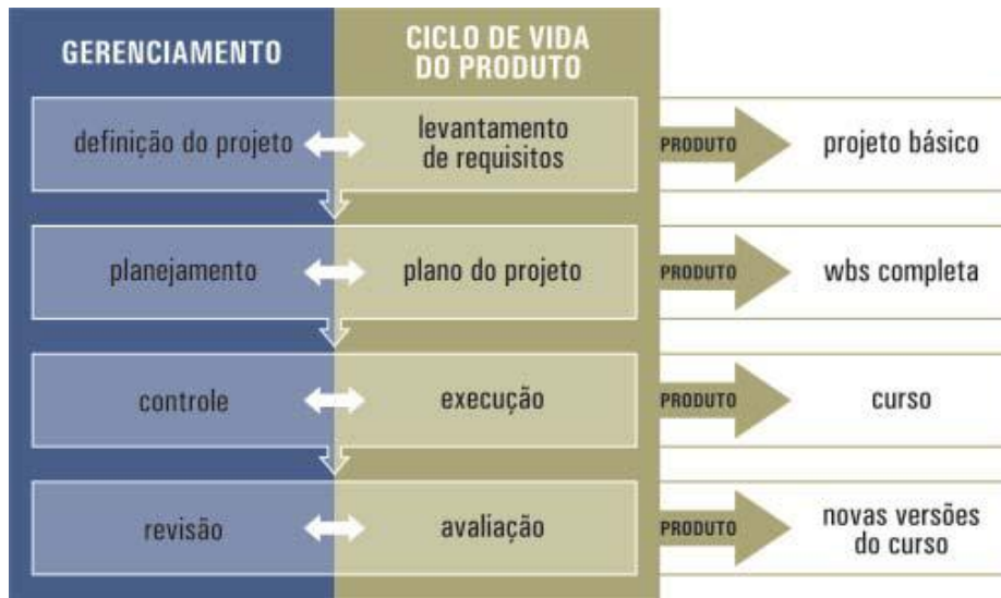
Figura 1- Estrutura da Metodologia Proposta.

A metodologia propõe uma estrutura de organização do projeto que facilita o trabalho em equipe e garante uma visão global do projeto. A construção dos objetos de aprendizagem foi formulada dentro de uma estrutura analítica do projeto seguindo a estrutura do curso, composto por elementos mistos, onde parte da estrutura é hierárquica e parte em rede. Desta forma, a estrutura de curso foi subdividida em módulos, estes módulos, em cenas e estas em objetos compostos por roteiros, storyboards , textos, áudio e vídeos (Figura 2). O módulo do curso representa a maior unidade de informação a ser construída. Já acena representa a menor unidade de informação de um curso, sendo estruturada como uma sequência de conteúdo, avaliações e atividades interativas.