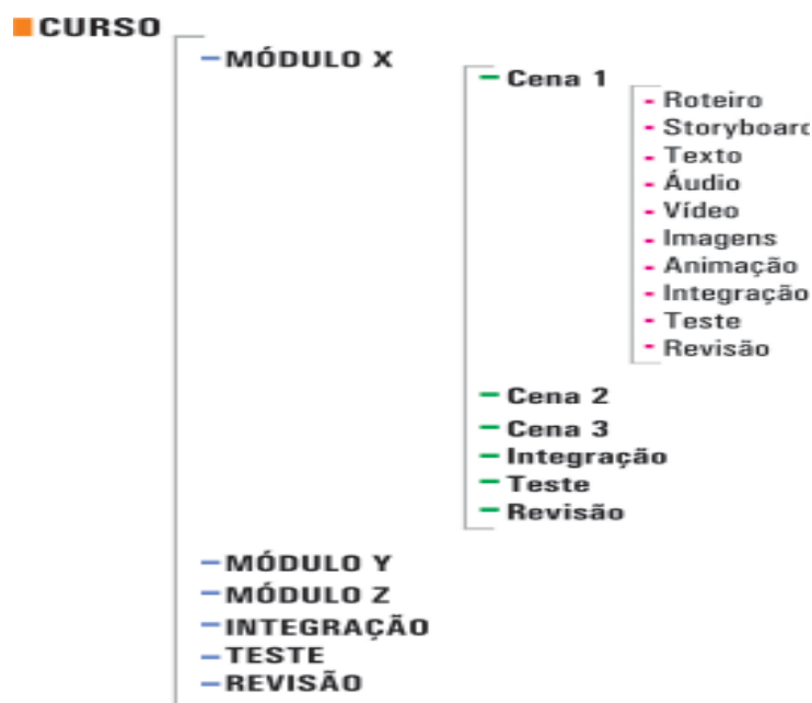
Figura 2- Estrutura de divisão para a construção de um curso.

A metodologia propõe uma estrutura de organização do projeto que facilita o trabalho em equipe e garante uma visão global do projeto. A construção dos objetos de aprendizagem foi formulada dentro de uma estrutura analítica do projeto seguindo a estrutura do curso, composto por elementos mistos, onde parte da estrutura é hierárquica e parte em rede. Desta forma, a estrutura de curso foi subdividida em módulos, estes módulos, em cenas e estas em objetos compostos por roteiros, storyboards , textos, áudio e vídeos (Figura 2). O módulo do curso representa a maior unidade de informação a ser construída. Já acena representa a menor unidade de informação de um curso, sendo estruturada como uma sequência de conteúdo, avaliações e atividades interativas.