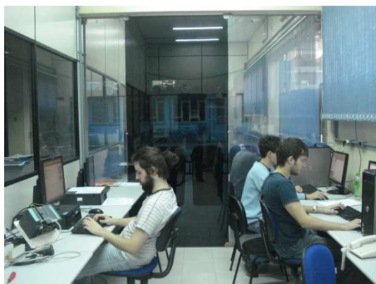
Figura 3 – Equipe do projeto CILEAM

PET no cumprimento de um dos objetivos do programa PET, qual seja, o de melhorar o curso de graduação no qual se insere. Esta contribuição ao curso está sendo oferecida através da implementação do laboratório, do suporte às disciplinas durante as aulas, dos roteiros preparados com intuito de auxiliar o uso dos equipamentos do laboratório durante as aulas e através dos cursos que serão oferecidos para a graduação na SETEEL, que contam com material didático que será disponibilizado no site do PET ( www.pet.joinville.udesc.br ). É possível observar que a dinâmica de trabalho deste projeto proporciona a melhoria do curso de graduação pelos próprios alunos da equipe. Isto implica na formação de agentes ativos em seu ambiente de atuação. Este panorama da relação entre os alunos do PET e os voluntários da graduação se aplica aos demais projetos apresentados, que também contam com discentes voluntários e, em alguns casos, bolsistas de extensão.