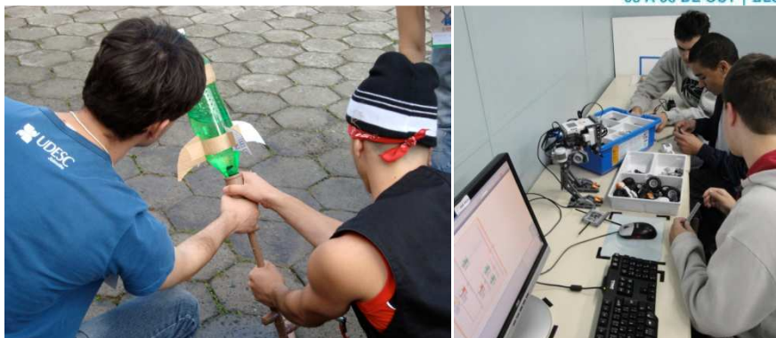
Figura 2 - Voluntário do DEEM (esq.) e montagem de robô no Engenharia é LEGal (dir.)