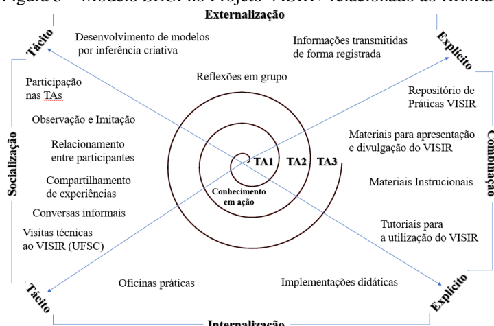
Figura 5 – Modelo SECI no Projeto VISIR+ relacionado ao RExLab

Desta forma, ao construir o modelo SECI (Figura 5) no projeto VISIR+ relacionado ao RExLab, percebeu-se que cada uma das fases do modelo são identificadas perante as ações e as iniciativas propostas e desenvolvidas pelo RExLab, a fim de proporcionar o compartilhamento do conhecimento, no qual resulta na espiral da criação do conhecimento.