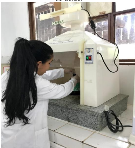
Figura 2: Demonstração do manuseio de ácido.

Portanto, torna-se notório o auxílio durante as aulas de laboratório com mais de um monitor para os alunos, para auxiliar nas demonstrações de experimentos como mostrado nas Figuras 2 e 3. Pois, a turma de engenharia civil 2018.2 contou com apenas um monitor durante as aulas, enquanto a turma de engenharia civil 2019.2 com dois monitores. E concluiu-se, que o nível de desempenho da turma de engenharia civil de 2019.2 foi superior devido a isto. Tais resultados irão refletir em um bom desempenho nas disciplinas futuras do curso, como "Ciência e Engenharia dos Materiais", "Materiais da Construção Civil", "Concreto e Argamassas" e entre outras disciplinas que têm a química como base.