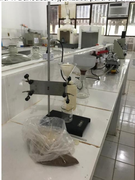
Figura 1: Bancada organizada para experimento.

A monitoria consistiu no acompanhamento de dois monitores presentes na sala de aula juntamente com o professor que ministrou a componente curricular de Química Experimental, durante um período de duas semanas. Desse modo, os monitores e o docente responsável pela disciplina trabalharam em conjunto, proporcionando à turma a ter um acompanhamento mais incisivo durante o período que ambos estavam trabalhando, sendo realizado apoio técnico-científico durante as práticas no laboratório, bem como nas nas práticas experimentais atividades, relatórios e etc, cujos objetivos eram estimular os alunos para obtenção de conhecimento. Como também, sanar as dúvidas durante as aulas, auxiliar nos experimentos laboratoriais e na organização das bancadas do laboratório para receber os alunos, conforme ilustra a Figura 1.