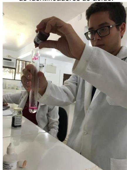
Figura 3: Apresentação do manuseio de identificadores de ácido.