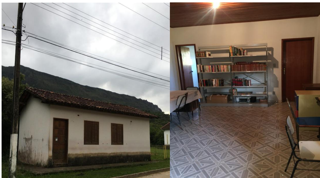
Figura 4 – Espaço Externo e interno Clube das Mães.

A implantação da biblioteca no Clube de Mães (Figura 4) foi realizada de modo estratégico visando conciliar as atividades artesanais com as desenvolvidas pela biblioteca. As mães, além de exercerem seus trabalhos, podem participar constantemente do espaço desfrutando dos recursos literários ali presentes.