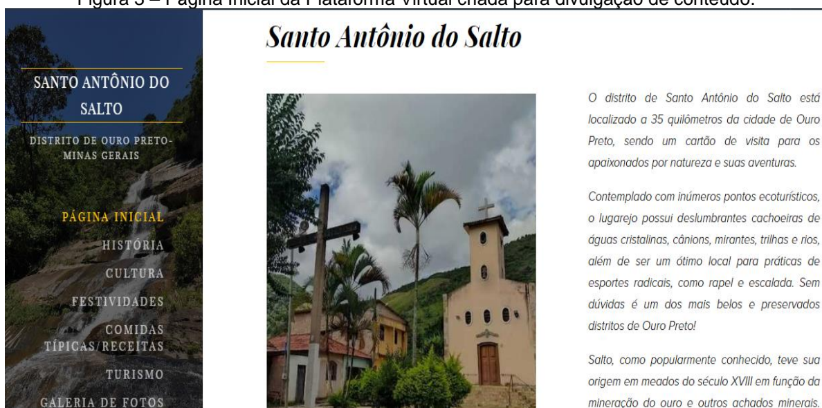
Figura 3 – Página Inicial da Plataforma Virtual criada para divulgação de conteúdo.

Além das redes sociais, foi criada uma plataforma virtual (Figura 3) com o intuito de resgatar a memória local, valorizar a cultura e as tradições da comunidade. Notou-se uma escassa fonte de informações e registros sobre o distrito, o que reafirmou a necessidade de criação de mecanismos que proporcionem a transmissão de saberes locais para gerações presentes e futuras.