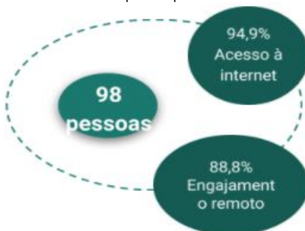
Gráfico 1 - Respostas questionário virtual