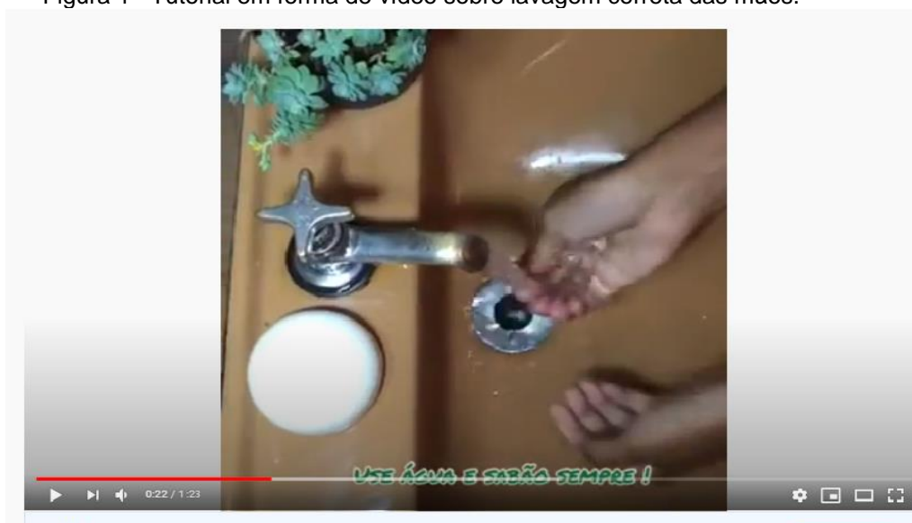
Figura 1 –Tutorial em forma de vídeo sobre lavagem correta das mãos.

Objetivando estreitar a relação entre projeto e comunidade foram criadas redes sociais como Facebook e YouTube nos quais foram postados vídeos curtos contando com a participação popular. Entre os vídeos está um tutorial sobre lavagem das mãos elaborado por uma moradora do distrito (Figura 1). Além de promover a interação dos habitantes, o vídeo buscou incentivar e orientar o telespectador acerca da importância da prevenção e a necessidade de combate ao vírus da Covid-19.