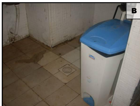
Figuras 04A e 04B - Caixa de gordura sem septo e ralo com grelha fixa.

Com base nos parâmetros de condição sanitária e de conforto, dispostos na NR-24, constatou-se que nos estabelecimento existe apenas um banheiro, um vestiário, e um lavatório para uso dos empregados, assim como não há chuveiro em funcionamento. Vale destacar que, devem existir banheiros e vestiários separados por sexo, além de lavatórios na entrada do ambiente em que se manipulam alimentos para evitar contaminações externas e que os banheiros estejam em boas condições de uso para os trabalhadores, caso não verificado na referida cantina, demonstrando que o local de trabalho não está com o perfil adequado para os funcionários atuantes naquele ambiente.